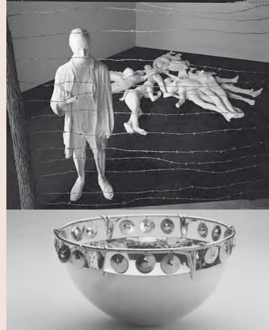
George Segal, The Holocaust , 1982. The Jewish Museum. Art © The George and Helen Segal Foundation/Licensed by VAGA, New York, NY. Amy Klein Reichert and Steven Smithers, Miriam Cup , 1997. The Jewish Museum. Photo by Richard Goodbody. COVER: The Jewish Museum © Peter Aaron/Esto. All rights reserved.

Cuando se lo solicite, se ofrece un descuento a los visitantes con discapacidades. Los precios para la admisión son vigentes a partir de la fecha de impresión del folleto. Los precios están sujetos a cambios sin aviso. El Museo acepta Visa, Master Card y American Express.